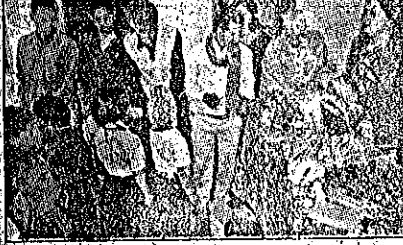
टीकाकरण कार्यक्रम में मौजूद बच्चे